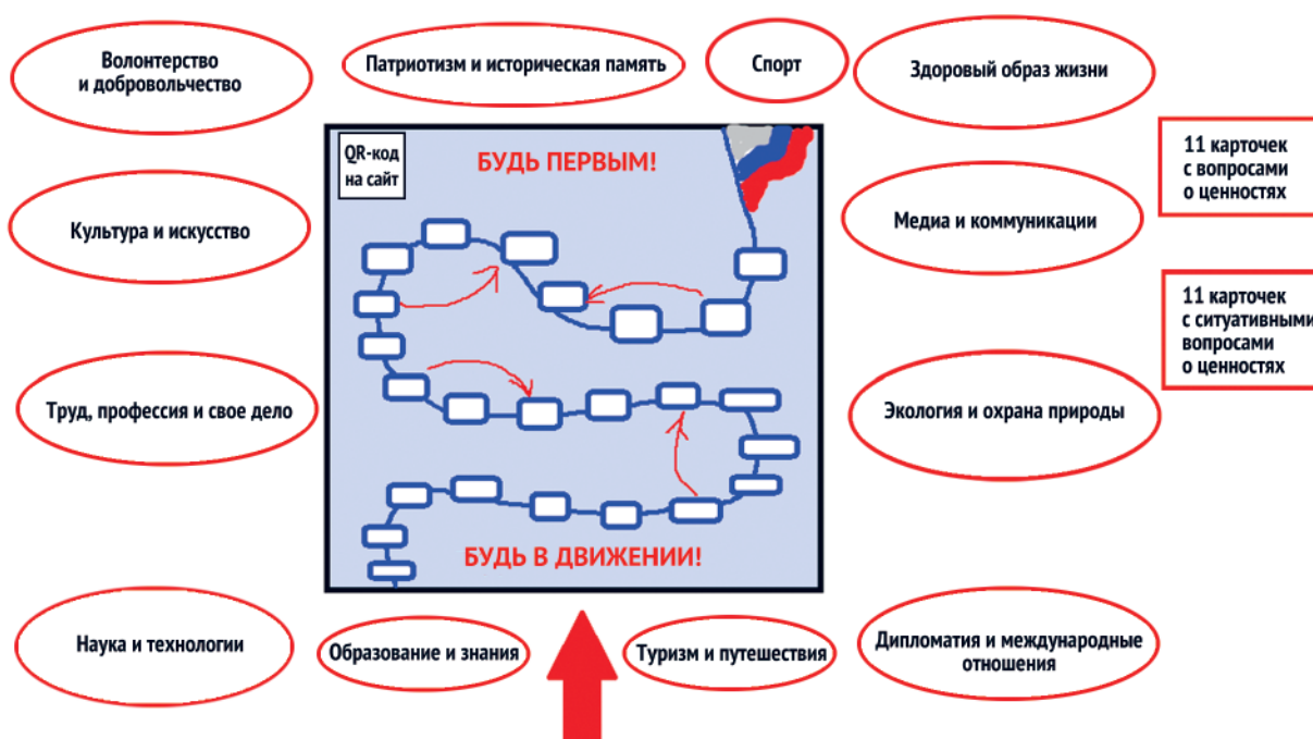
Рис. 1. Игровое поле Игры